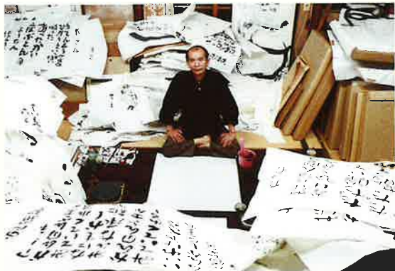
栃木県足利市八幡町の旧アトリエにて