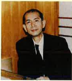
「にんげんだもの」1980年