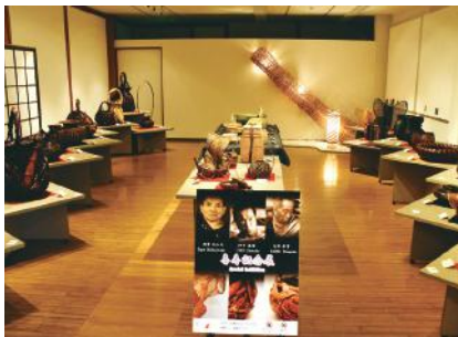
2018年喜寿記念展の様子