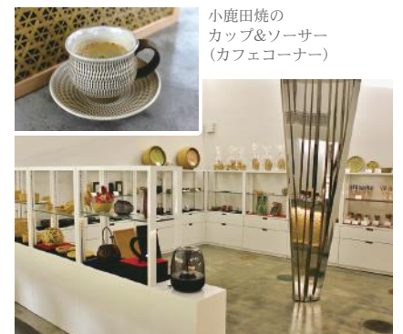
小鹿田焼の カップ&ソーサー (カフェコーナー)

コーヒーなどを楽しめるカフェコーナーも併設しており、竹林を眺めながらゆっくりとしたひとときをお過ごしいただけます。